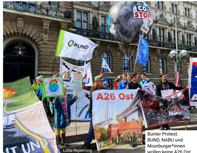
Bunter Protest. BUND, NABU und Moorburger*innen wollen keine A26 Ost.

Ebenfalls schlecht für das Klima wären die enormen CO 2 -Emissionen, die durch den Bau der Tunnel und der Brücken verursacht würden. Der Hamburger Senat will davon aber nichts wissen, da dieser CO 2 -Ausstoß bei den Firmen berechnet wird, die den Zement herstellen. Und diese sind nicht in Hamburg. So geht „Greenwashing“.