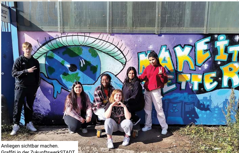
Anliegen sichtbar machen. Graffiti in der ZukunftswerkSTADT.

K limakrise mal anders: Vier Tage lang hat die BUNDjugend im Rahmen des Projekts ZukunftswerkSTADT das Thema Klimakrise auf besonders kreative Art bearbeitet. Stattgefunden hat das Ganze auf dem inspirierenden Ort minitopia in Wilhelmsburg und die Schüler*innen der 11a aus der Stadteilschule Stübenhofer Weg haben sich selbst übertroffen.