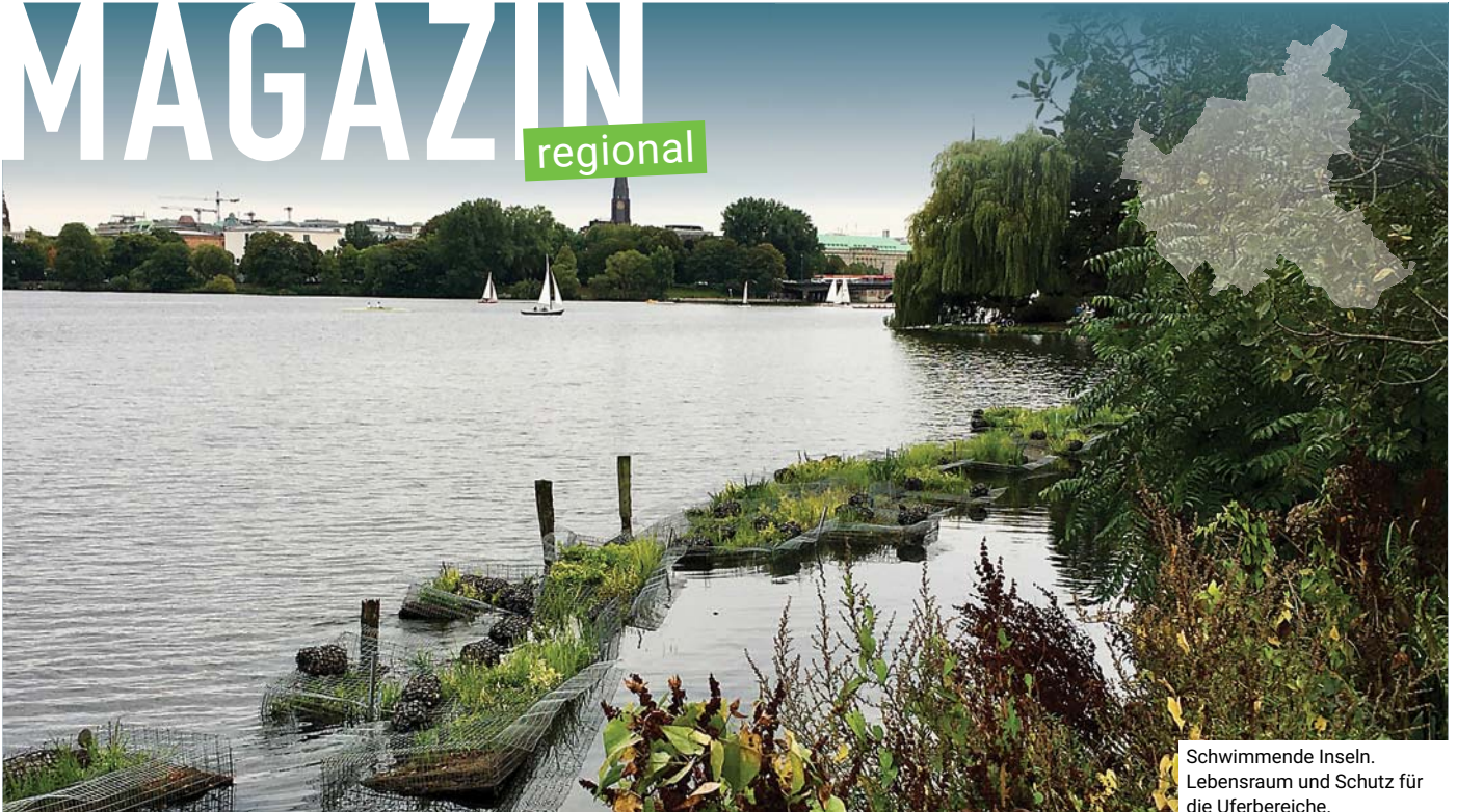
Schwimmende Inseln. Lebensraum und Schutz für die Uferbereiche.